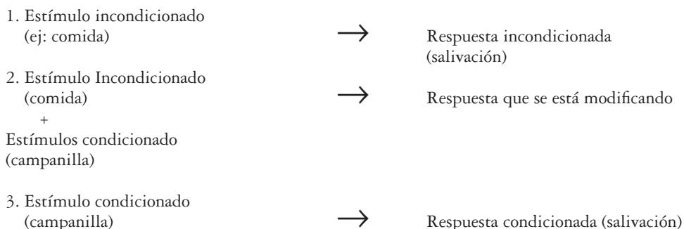
Figura 2.1. Esquema de condicionamiento clásico

El condicionamiento clásico es el proceso a través del cual se logra que un comportamiento -respuesta- que antes ocurría tras un evento determinado -estímulo- ocurra tras otro evento distinto. El condicionamiento clásico fue descrito por el fisiólogo ruso Ivan Pavlov (1849-1936) a partir de sus estudios con animales; en sus investigaciones, asoció el ruido de una campanilla (estímulo neutro) a la comida (estímulo incondicionado) de un perro, y logró que el perro salivara al escuchar la campanilla (que se transformó en un estímulo condicionado). La figura 2.1 describe las etapas del condicionamiento clásico.